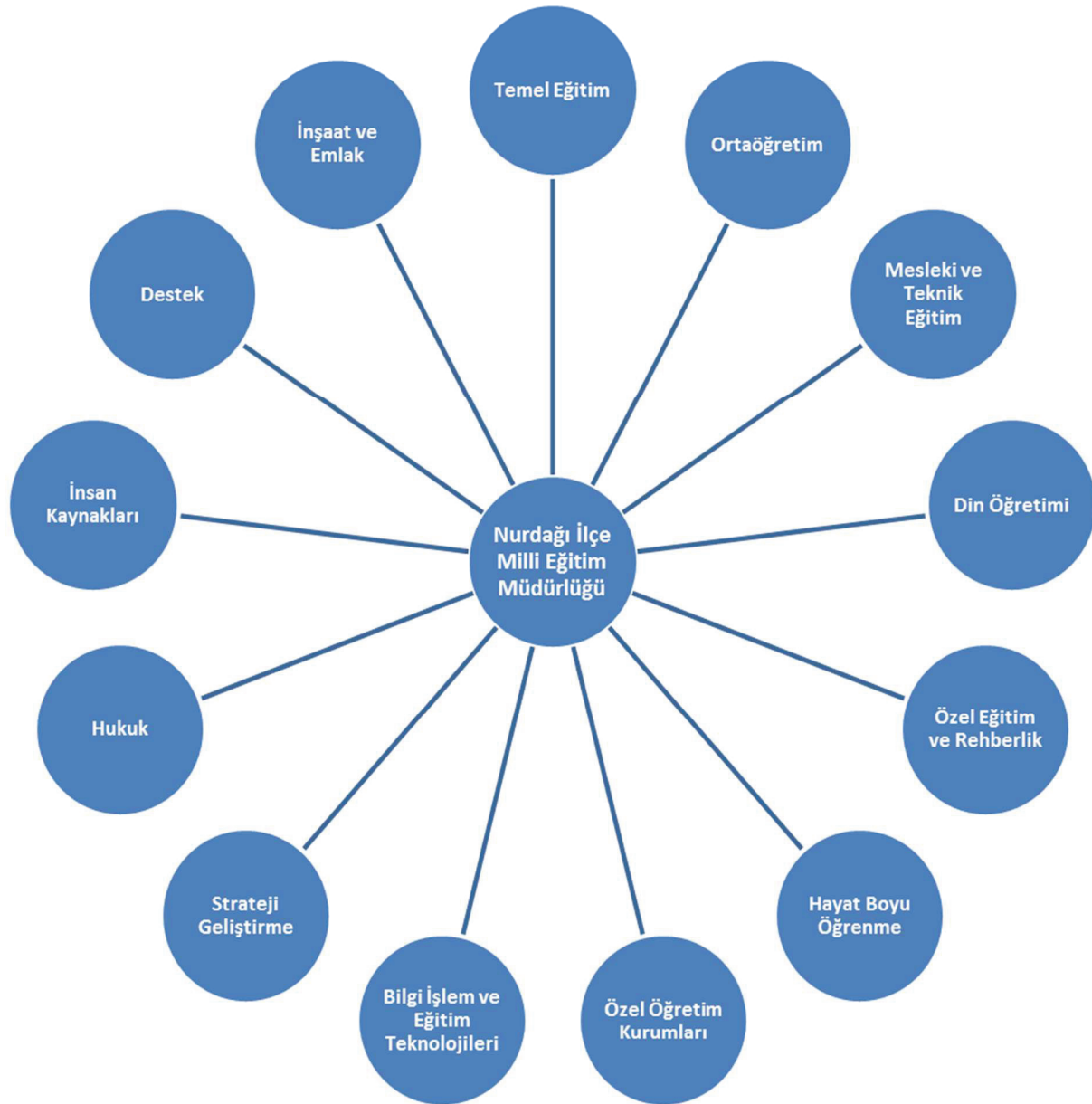
Tablo 4. Nurdağı İlçe Millî Eğitim Müdürlüğü Organizasyon Şeması